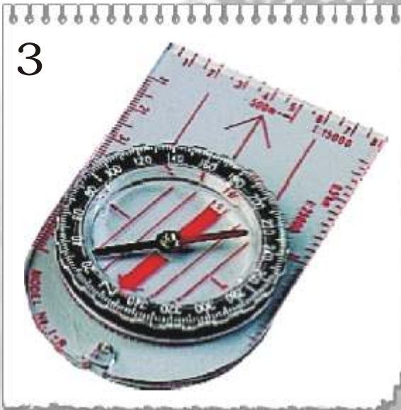
3 65014300 : BOUSSE À LIQUIDE 50 mm 2 ÉCHELLES GRADUÉES