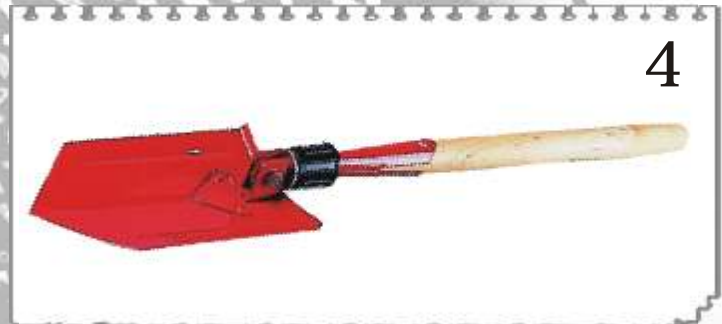
4 9387F : FELLE AMÉRICAINE COLORES SELON DISPONIBILITE