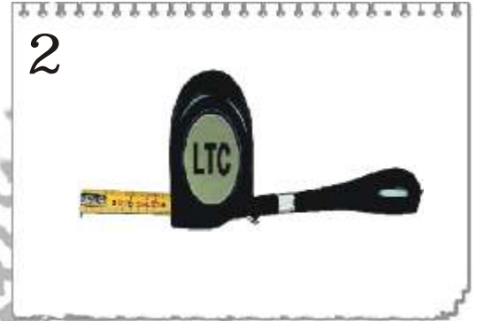
2 9323D : DOUBLE MÈTRE