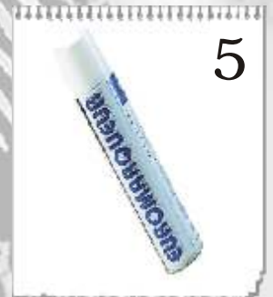
5 9216C : BOMBE TRACER ROUGE FLUO