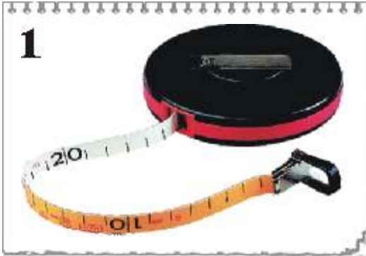
1 9322D : DÉCAMÈTRE