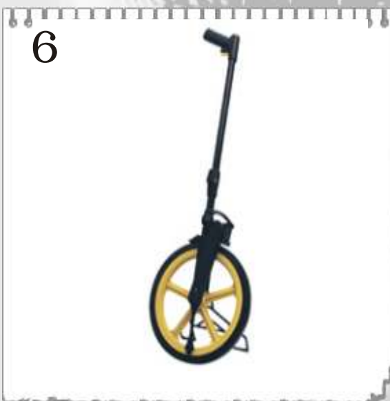
6 85490 : ROUE D'ARPEUR AVEC PNEU EN CAOUTCHOUC - MESURE EN AVANT ET EN ARRIERE - MISE A ZERO - 49 CM DE HAUT REPLIE - BEQUILLE FREIN D'IMMOBILISATION